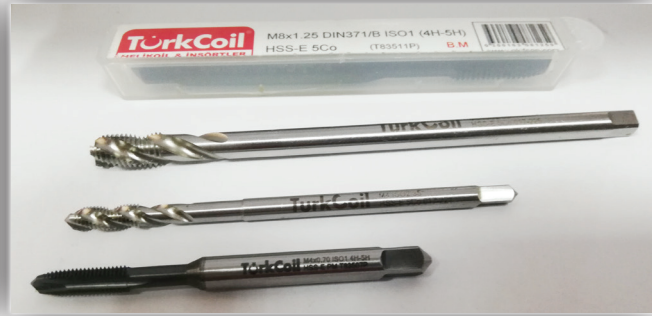
HSS-E Özel Uzun Seri Profesyonel Helicoil Klavuzları

Helicoil klavuzlarında karşılaşılan büyük sorunlardan birisi, klavuzların sap çaplarının emniyetli tip tutuculara uygun olmamasıdır. Ancak Pro-Seri klavuzlarda sap çapı standart DIN371 B/C formuna uygundur.