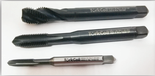
HSS-E ve PM Serisi Profesyonel Helicoil Klavuzları

Helicoil klavuzlarında karşılaşılan büyük sorunlardan birisi, klavuzların sap çaplarının emniyetli tip tutuculara uygun olmamasıdır. Ancak Pro-Seri klavuzlarda sap çapı standart DIN371 B/C formuna uygundur.